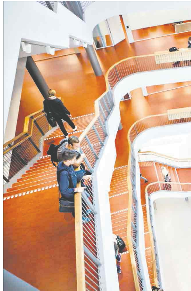
SVENSK TILSTANDER: Høgskolen i Malmö fikk i 2015 prestisjebygget Niagara med aktivitetsbaserte arbeidsplasser, som nå gjør sitt inntog i statlige bygg også i Norge.

– Vi har ulike forutsetninger for arbeidet. Det kan ikke