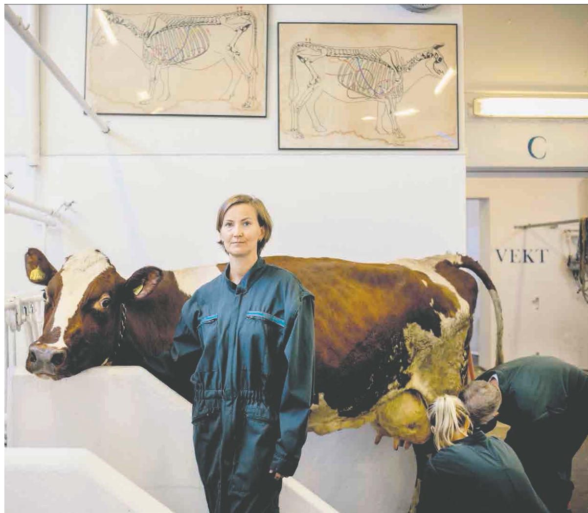
professor ved Veterinærhøgskolen i Oslo, som snart skal flyttes til Ås. Hun vil ikke dele kontor med kollegene.