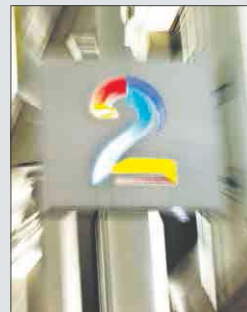
STRID: Om kildevern i TV 2.

Norsk Journalistlag (NJ) sier seg uenige med TV 2s fremgangsmåte i jakten på en intern lekkasje, men går ikke videre med saken.