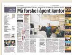
Klassekampen 12. august

■ Flere nye universitetsbygg planlegges med variasjoner over slike kontorløsninger.